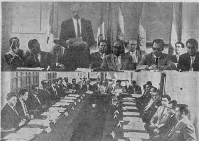
La gráfica recoge dos aspectos de la inauguración del Seminario sobre Servicio Civil efectuada ayer en el local de la ESAPAC, con asistencia del señor Presidente de la República don