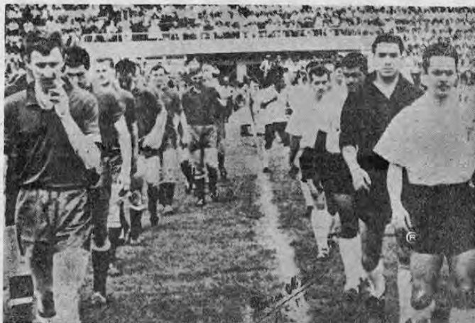
Los dos equipos entraron juntos al terreno de juego siendo recibidos con grandes aplausos por la concurrencia. En esos momentos bullia en la mente de los aficionados el temor de una goleada. Nadie se imaginaba que por el contrario estaba a punto de escribirse en la cancha una página histórica de nuestro fútbol.