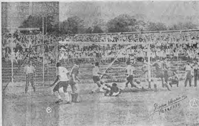
Faltando pocos minutos para terminar el partido los rusos le empataron al Alajuelense en una de esas jugadas que no se puede hacer nada porque la bola muerta los cordales. Esta gráfica después del disparo del extremo izquierdo ruso Mesli fuera de foco, es fiel reflejo de la que sucedió.