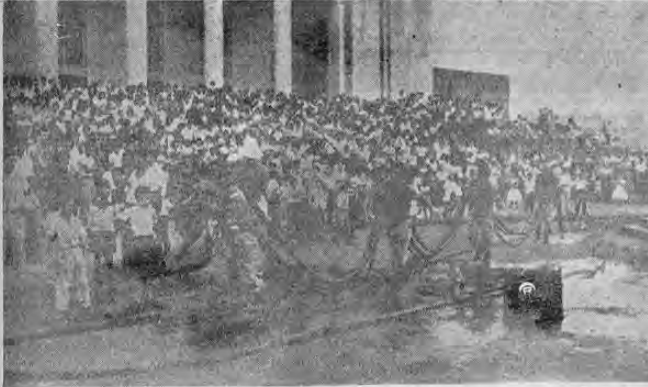
Las gráficas de Carrillo recogen dos aspectos de las maniobras conjuntas efectuadas el domingo en horas de la mañana, por los bomberos de las estaciones de Barrio México y de Turrialba. Gran cantidad de público, como puede apreciarse en el arreglo gráfico, se dio cita frente al edificio de la Universidad vieja en Barrio González Lahmann. En una de las gráficas, los bomberos demuestran cómo se combate un incendio de gasolina —contenida en esta ocasión en un estacionamiento— con una mezcla de agua y espuma.