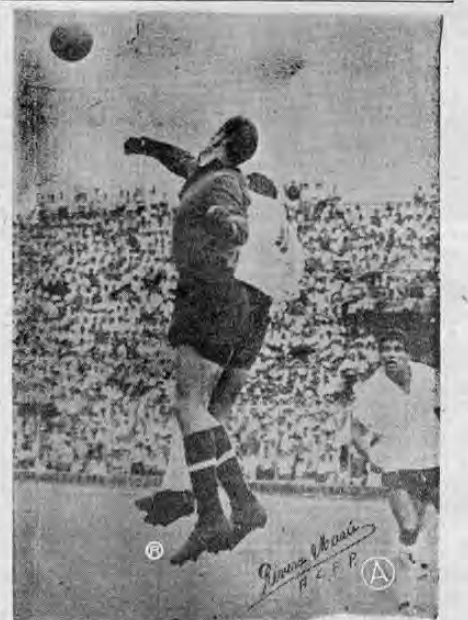
Sin duda alguna el portero Yashin es un portero en los tubos. Es el portero titular de la selección rusa que irá al Mundial. En el encuentro contra los alajuelenses tuvo que sobreponerse, tal y como lo vemos en la foto cuando Acuña lo acosaba y Guido Alvarado a la expectativa.