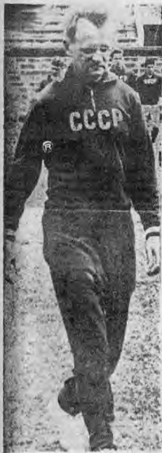
KACHALIN.— Después del partido se sorprendió de la forma de actuar el equipo alajuelense manifestando que no sabía qué aquí se jugará tanto fútbol